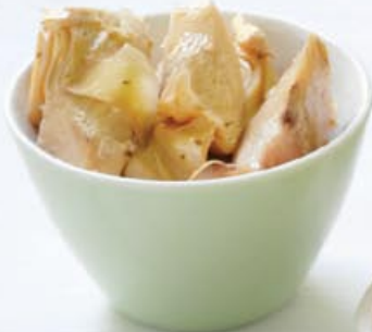
TapaZ Grillede artiskokker i solsikkeolie