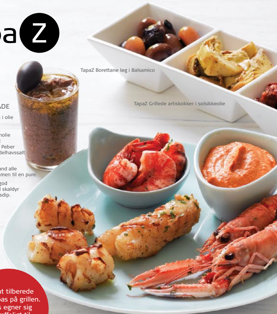
TapaZ Grillede artiskokker i solsikkeolie

Prøv at tilberede dine tapas på grillen. Tapas egner sig fortræffeligt til sommerhygge på terrassen.