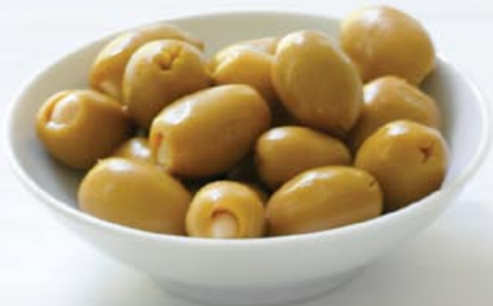
TapaZ Oliven med mandel