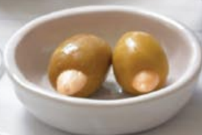
TapaZ Oliven med mandel